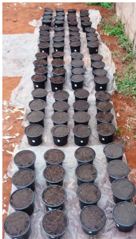
Figura 1. Disposição dos vasos com as diferentes concentrações de fertilizante Classe D.

Faltou uma análise química e física do substrato de todos os tratamentos. Os efeitos dos tratamentos