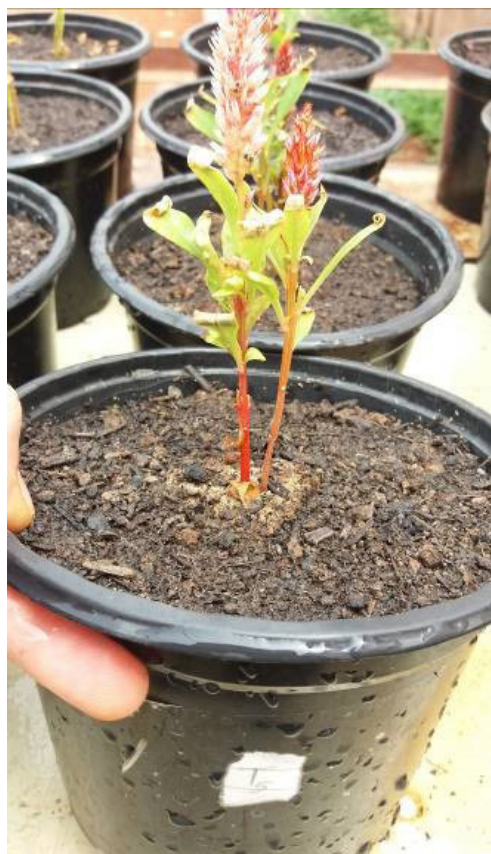
Figura 3. Detalhe da flor em pleno desenvolvimento.

no desenvolvimento das plantas estão provavelmente relacionado com os atributos do substrato (nutrientes, pH, CE, retenção de água). Sem essas informações não é possível identificar porque as maiores doses de FCD não permitiram um bom desenvolvimento das plantas.