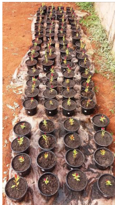
Figura 2. Disposição dos vasos com as mudas transplantadas.